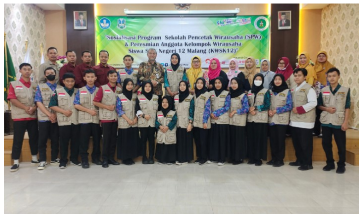
Gambar 1. Sosialisasi program SPW dan peresmian anggota KWSK 12

Peserta kegiatan dari Kepala Sekolah, Wakil Kepala Sekolah, guru PKDK dan Tim SPW, dan siswa yang bergabung di Kelomok Wirausaha Siswa SMKN 12 Malang. Tujuan kegiatan ini adalah untuk menghasilkan tamatan yang mampu menghadapi gelombang peradaban keempat yang saat ini dikenal dengan era pendidik 4.0 memaksa peran sekolah sebagai lembaga pendidikan menyesuaikan seluruh kerangka sendi dan perangkat kerja pada setiap segmen kehidupan yang menuntut Inovasi menjadi kunci paling utama di era industri 4.0. Melalui program yang bentuk pada kegiatan SPW, sekolah membentuk peserta didik memiliki kompetensi abad 21 yang mampu berfikir kritis, kreatif, kolaboratif, dan komunikatif dalam berwirausaha.