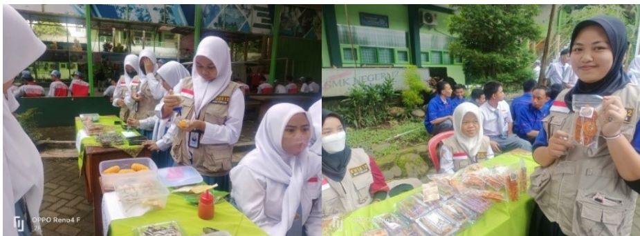
Gambar 13. Stand Bazaar Kelompok Wirausaha Siswa K12

Pada event ini digelar 27 stand kuliner, fashion dan asesoris dari kalangan siswa. Dari salah satu siswa menyampaikan bahwa jika ada kegiatan serupa pada event lain siap sebagai tenant dan opent booth untuk memasarkan produknya. Beraneka ragam produk yang di hasilkan siswa muali dari keripik , piscok, donat, tahu bakso , es coklat, es lumut rasa, mile crepes, nasi pecel, corn dog, cimol, pentol pedas, makroni, nasi ayam geprek, aneka camilan, brownis lumer di jual dengan harga mulai dari Rp. 2.000,00 hingga Rp 15.000,00.