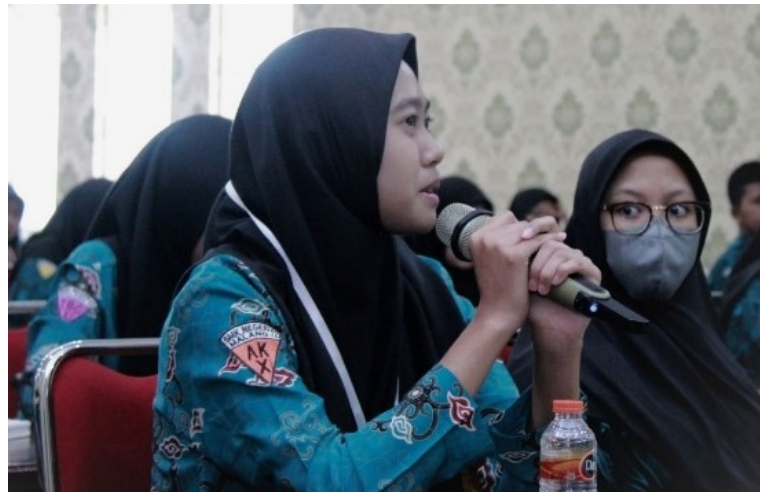
Gambar 10. Tanya jawab pada wokrshop pemanfaatan Digital Marketing