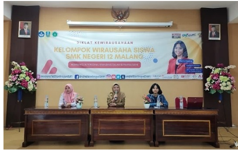
Gambar 4. Pembukaan diklat kewirausahaan membangun personal branding