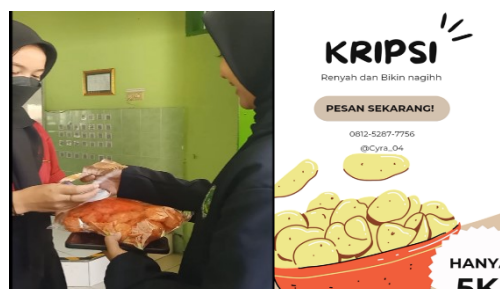
Gambar 23. Tiara Senja P, XII AKL.3