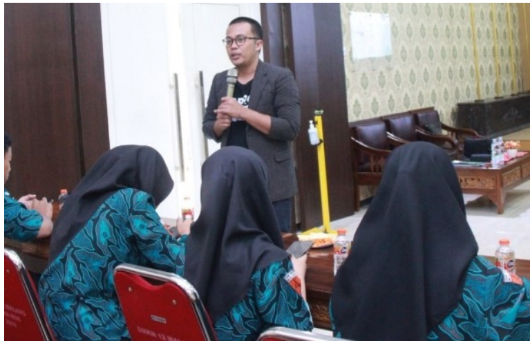
Gambar 9. Pemaparan materi wokrshop pemanfaatan Digital Marketing