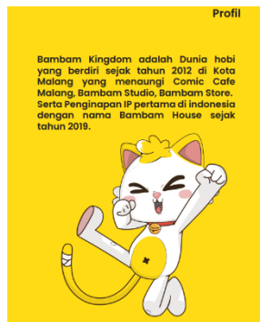
Gambar 23. Mitra kerja Bam Bam Kingdom