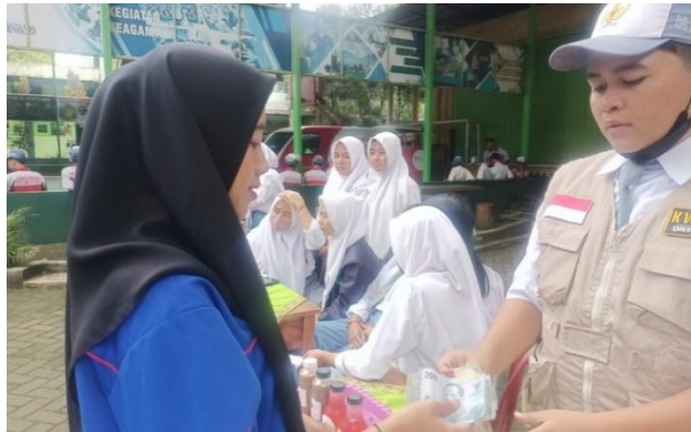
Gambar 14. Stand Bazaar Kelompok Wirausaha Siswa K12