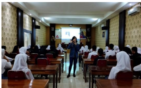
Gambar 5. Penyampaian materi diklat kewirausahaan membangun personal branding