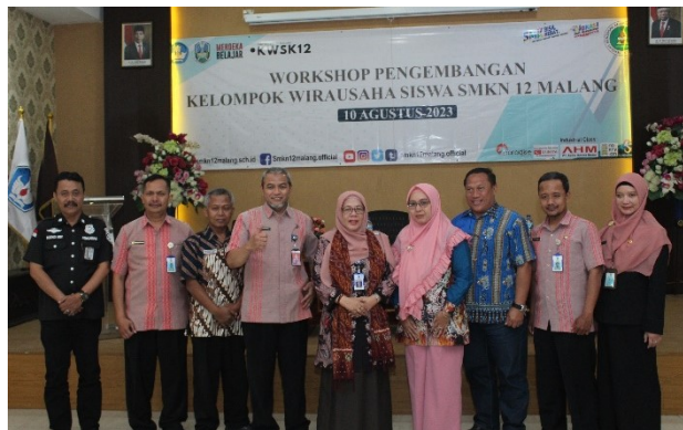
Gambar 21. Workshop pengembangan kelompok wirausaha siswa SMKN 12 Malang kerjasama dengan Entrepreneurship Training Unit (ETU) Politeknik Negeri Malang (POLINEM)