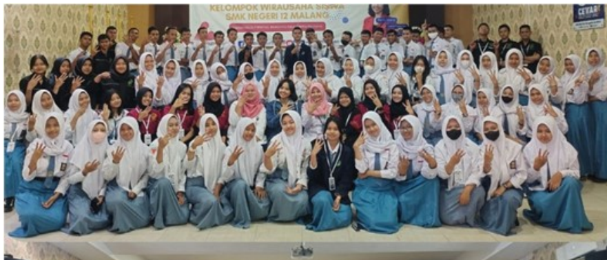
Gambar 7. Foto bersama diklat kewirausahaan membangun personal branding