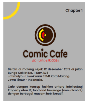
Gambar 24. Mitra Kerja Comic Cafe