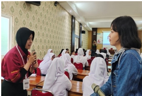
Gambar 6. Suasana tanya jawab diklat kewirausahaan membangun personal branding