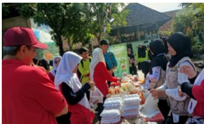
Gambar 19. Suasana Entrepreneur Day, kelompok wirausaha siswa membuka stand dan berjualan

Beberapa anggota Kelompok Wirausaha Siswa SMKN 12 Malang angkatan pertama dan kedua yang berwirausaha dalam kesehariannya: