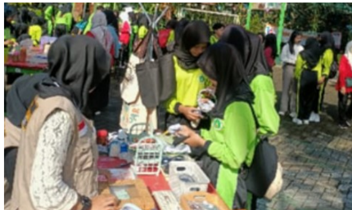
Gambar 17. Suasana Entrepreneur Day, kelompok wirausaha siswa membuka stand dan berjualan