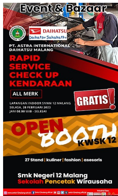
Gambar 12. Flyer Event dan Bazaar

Tujuan diselenggarakannya kegiatan ini adalah meningkatkan kemampuan pengembangan pembelajaran kewirausahaan, penguatan pembelajaran berbasis kewirausahaan, mengembangkan potensi siswa dalam bidang pengembangan pembelajaran kewirausahaan, dan menyiapkan lulusan SMK yang mempunyai jiwa wirausaha dan atau menjadi wirausaha.