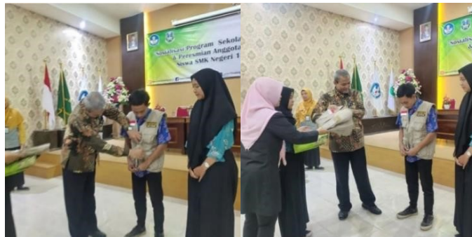
Gambar 2. Peresmian anggota Kelompok Wirausaha Siswa SMKN 12 Malang