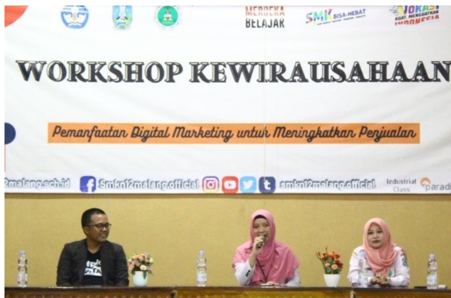
Gambar 8. Pembukaan wokrshop pemanfaatan Digital Marketing

Selain tujuan tersebut, ada beberapa manfaat pemanfaatan digital marketing, diantaranya mengenal lebih dalam mengenai digital marketing, mengefisiensi operasinal dan pemasaran yang tepat untuk meraih target pasar yang telah ditentukan, menghindari kesalahan dalam melakukan pemasaran melalui media digital.