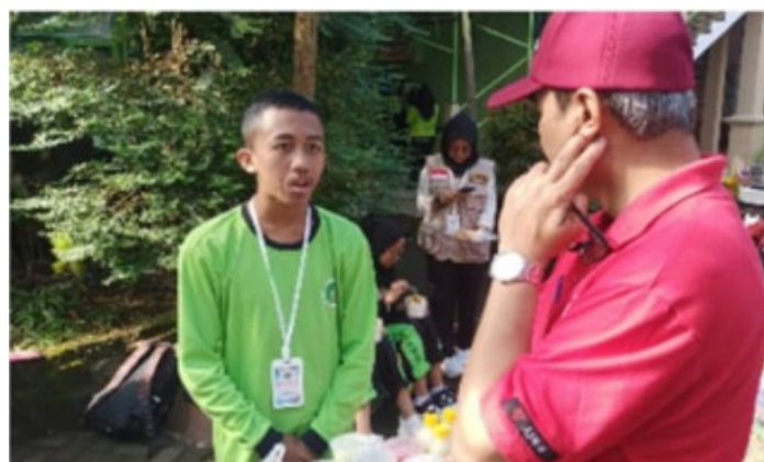
Gambar 18. Entrepreneur Day Kepala Sekolah berdialog dengan anggota kelompok wirausaha siswa