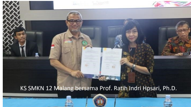
Gambar 20. Perjanjian Kerjasama (MoU) dengan POLINEMA (Bidang Kewirausahaan)