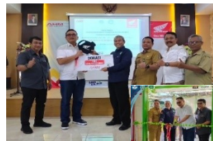
Gambar 25. SMKN 12 Malang menjadi Tempat Uji Kompetensi (TUK) Pertama di Kota Malang