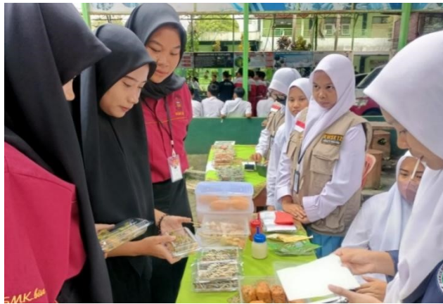
Gambar 15. Stand Bazaar Kelompok Wirausaha Siswa K12