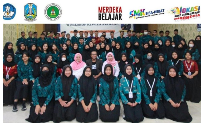
Gambar 11. Foto bersama narasumber dan peserta wokrshop pemanfaatan Digital Marketing