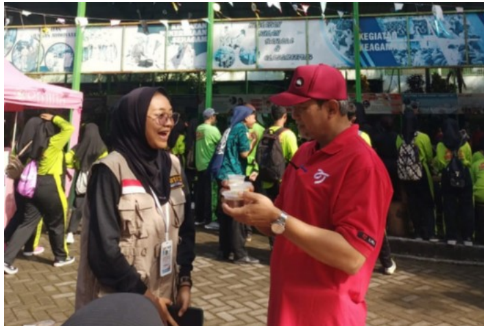
Gambar 16. Kepala Sekolah dialog dengan anggota KWSK12