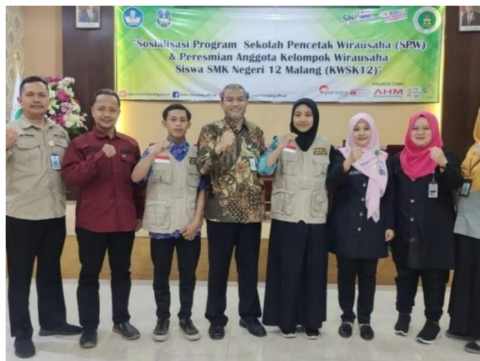
Gambar 3. Peresmian anggota Kelompok Wirausaha Siswa SMKN 12 Malang