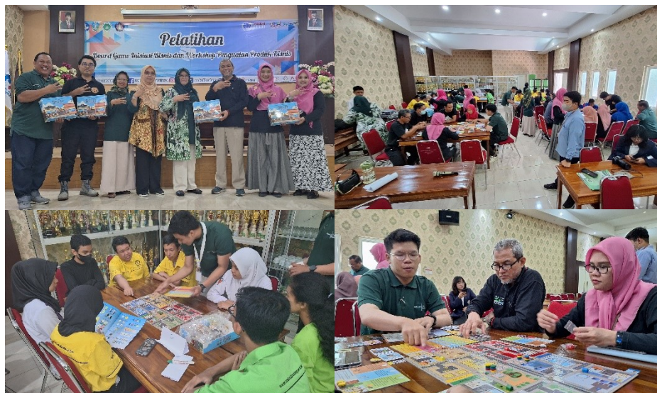
Gambar 22. Pelatihan Board Game Inisiasi Bisnis dan Workshop Penguatan Produk Bisnis kerjasama dengan ETU POLINEMA dan Bambam Kingdom (Comic Café)