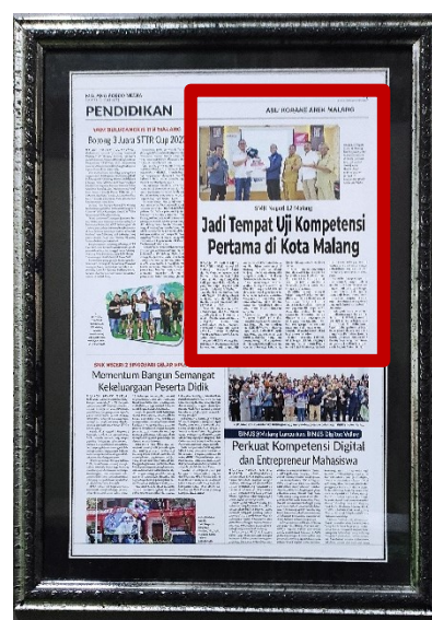
Gambar 26. Pemberitaan Persmian TUK TBSM SMKN 12 Malang di Media Massa